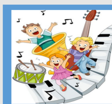
A scuola con ritmo