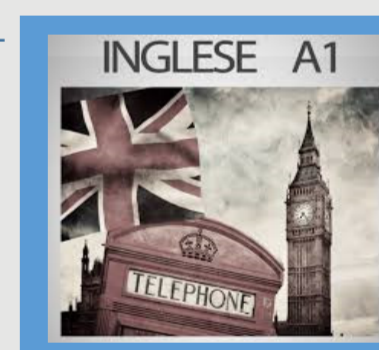
Travelling in my English word