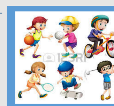
Sport è vita